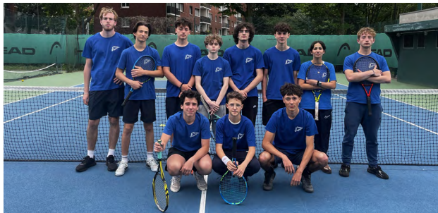
Équipe coaches juniors